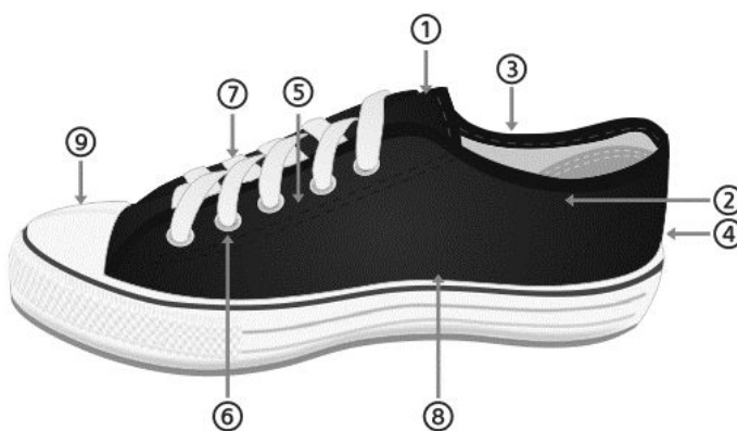
1 GÁSPEA 2 CANO 3 VIÉS 4 CONTRAFORTE 5 REFORÇO 6 ILHÓS 7 ATACADOR 8 LOGO 9 BIQUEIRA

CABEDAL: Parte superior do calçado que tem como matéria-prima básica de algodão na cor Pantone 19-3810 TPX dublada com sarja, com gramatura de 310 /m2 e insumos dentro das especificações de mercado conforme descrições que seguem: