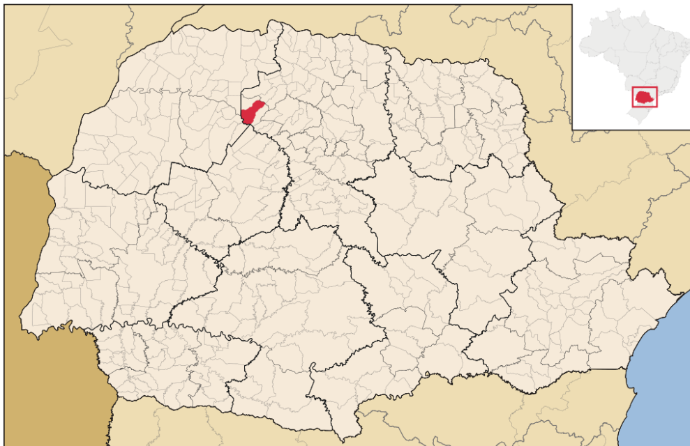
FIGURA 1. LOCALIZAÇÃO DO MUNICÍPIO- DIVISÃO POLÍTICA DO ESTADO DO PARANÁ

encontrada. permite visualizar a localização de São Jorge do Ivaí no Estado do Paraná.