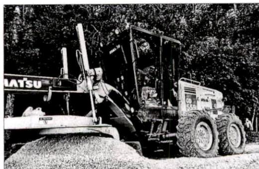
Foram utilizados mais de 700 cargas de cascalho no trabalho de revitalização das estradas rurais