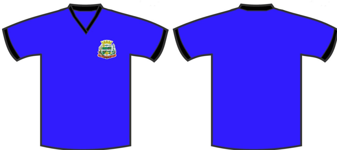
TABELA DE MEDIDA CAMISETA - BÁSICA