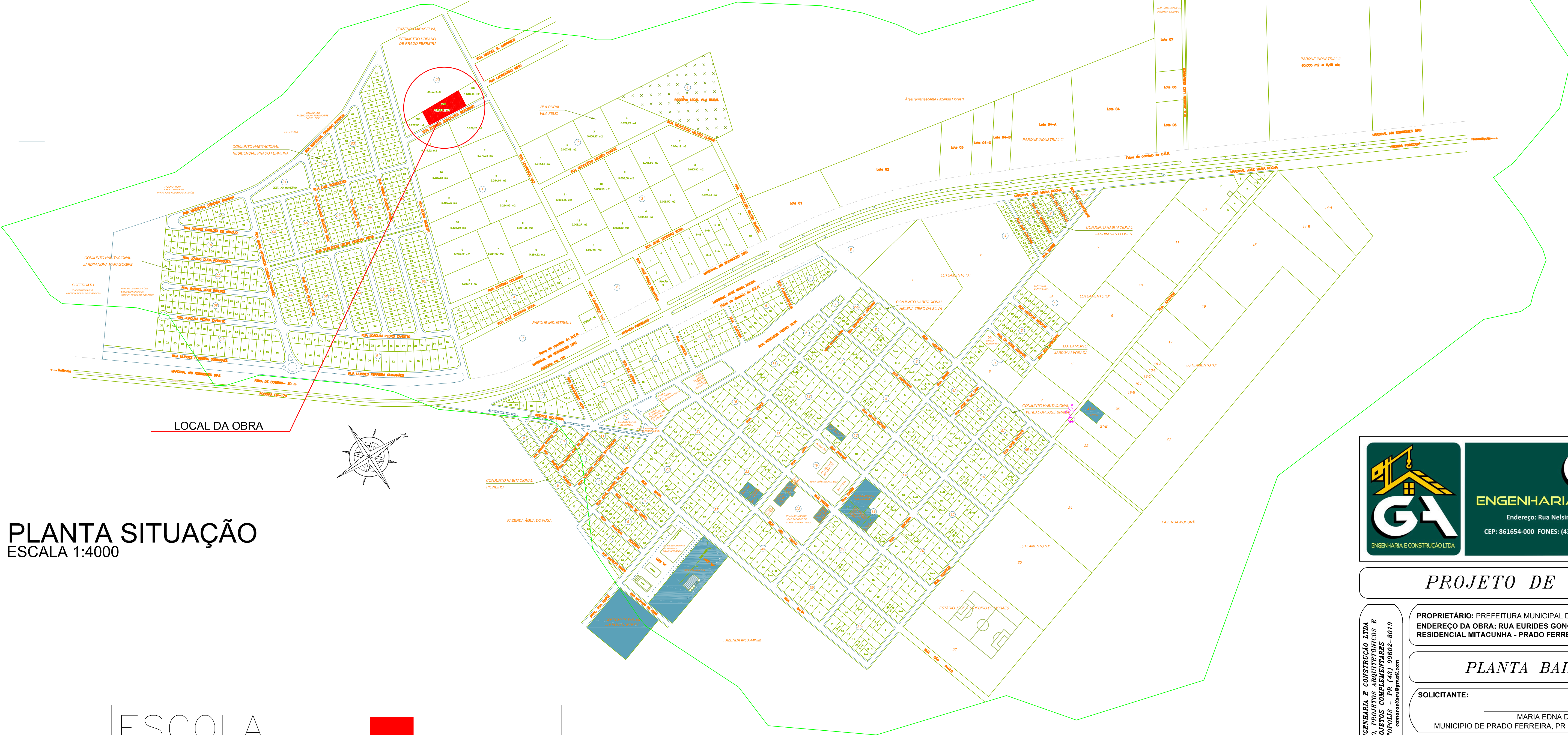
PLANTA SITUAÇÃO ESCALA 1:4000