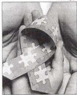
A elaboração e entrega do documento integra série de iniciativas promovida pelo MP