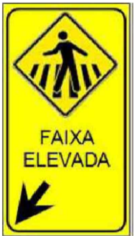
DETALHE PLACA SEM Escala