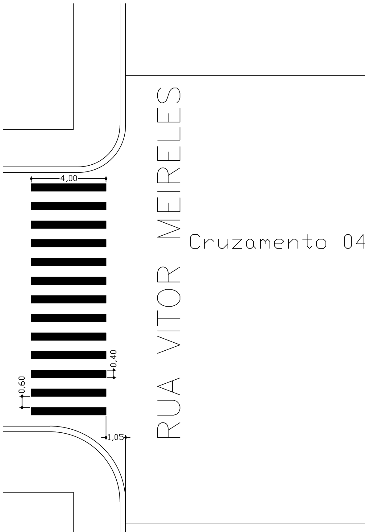
3 DET. SINAL. HORIZONTAL ESC: 1:125