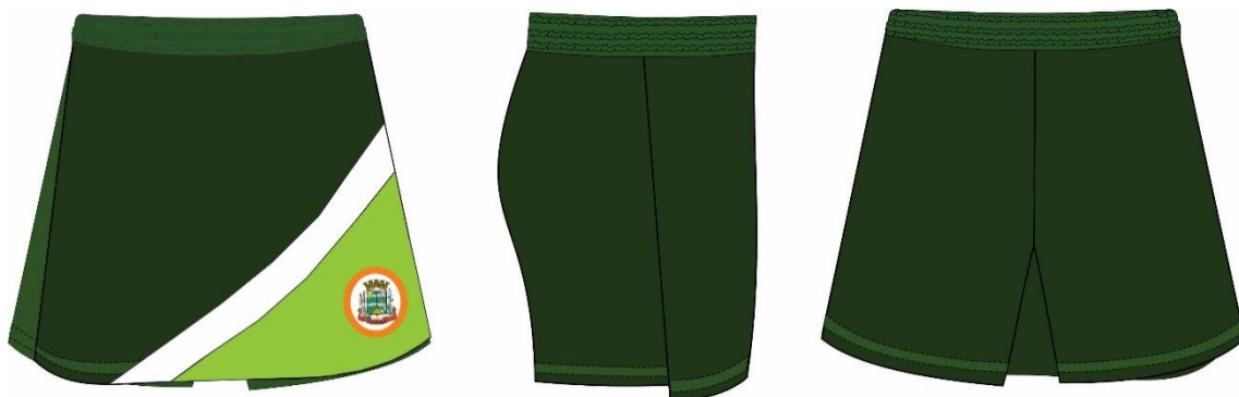
TABELA SHORT SAIA