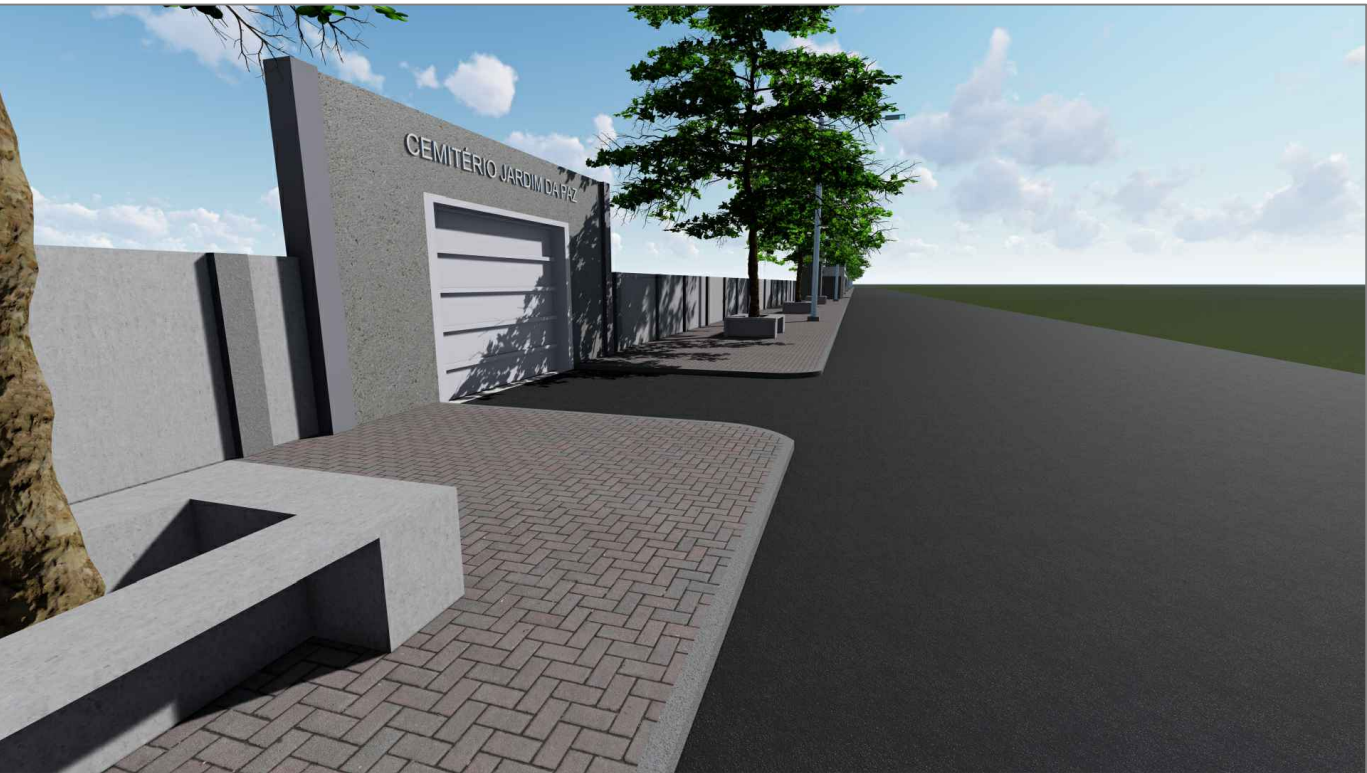
PORTÃO DE ACESSO - VISTA LATERAL