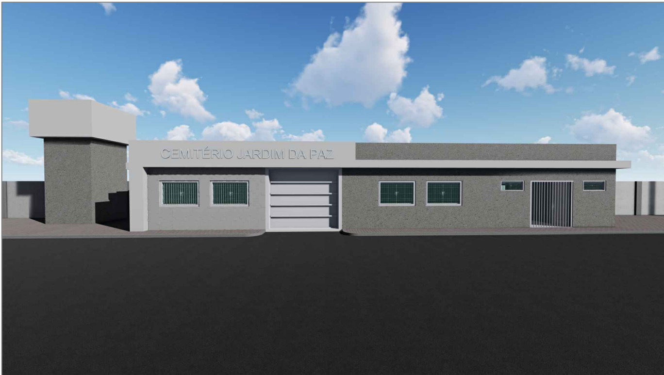
ESCRITÓRIO - VISTA FRONTAL