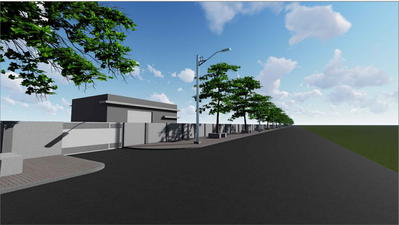
PORTÃO DE ACESSO 2 E BARRACÃO - VISTA LATERAL