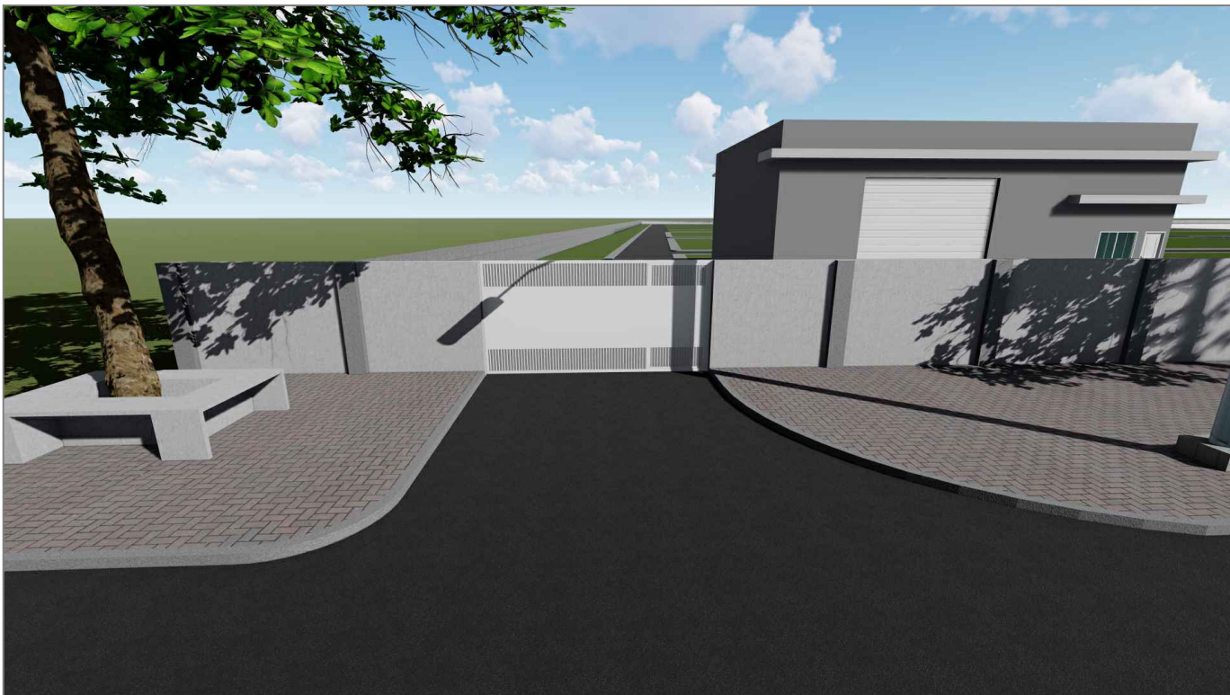
PORTÃO DE ACESSO 2 E BARRACÃO - VISTA FRONTAL