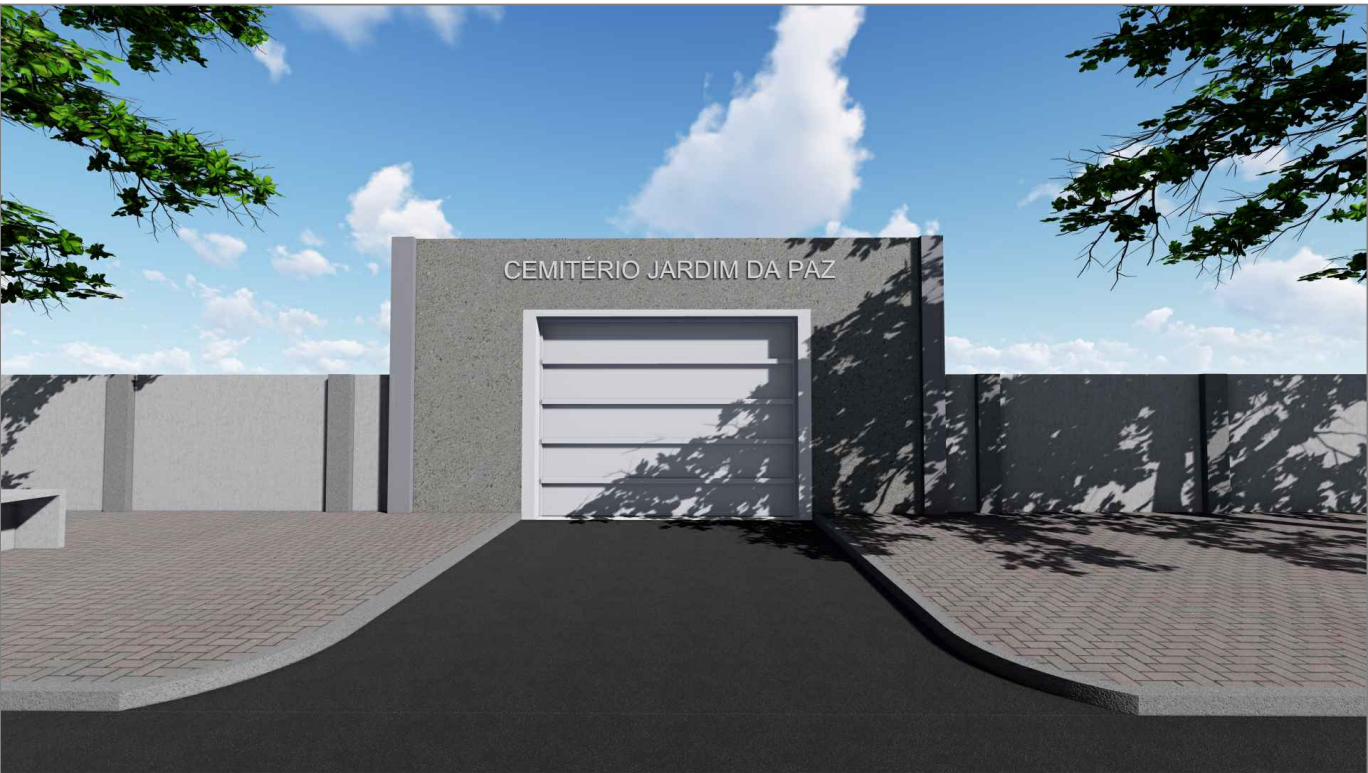
PORTÃO DE ACESSO - VISTA FRONTAL