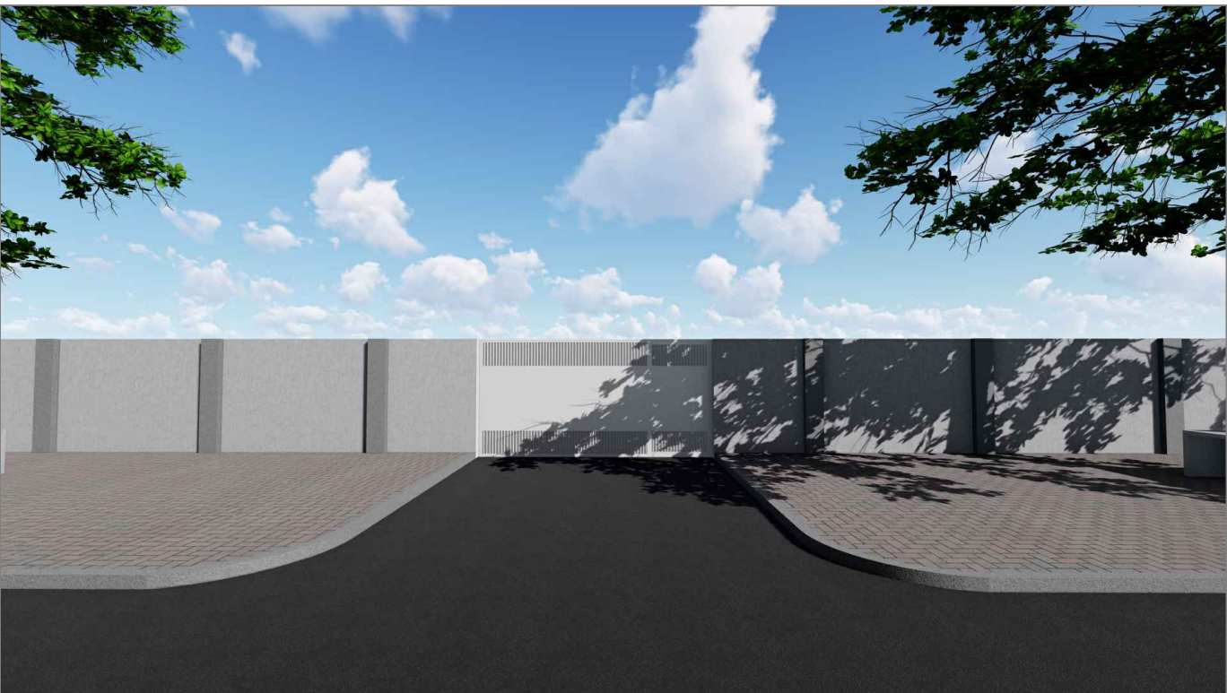
PORTÃO DE ACESSO 2 - VISTA FRONTAL