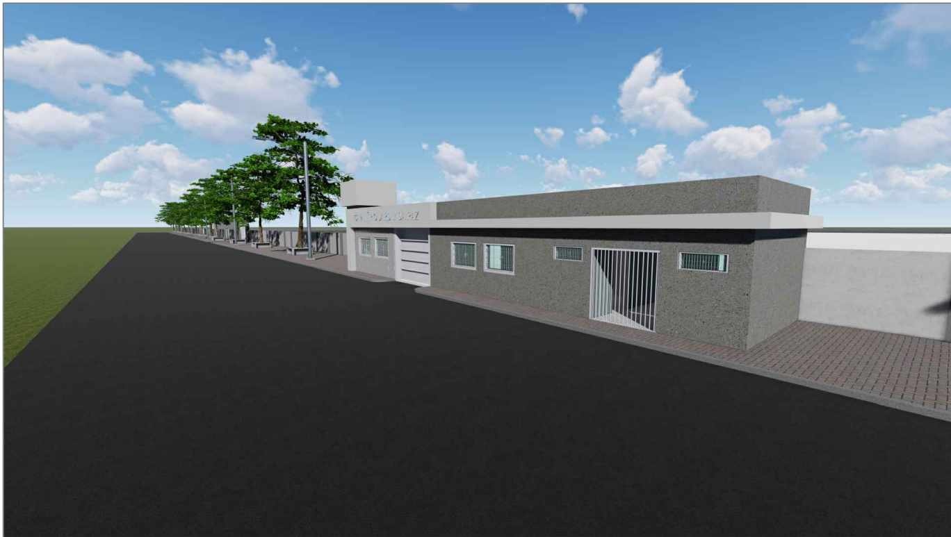
ESCRITÓRIO - VISTA LATERAL