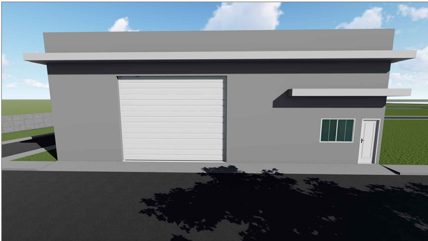
BARRACÃO - VISTA FRONTAL